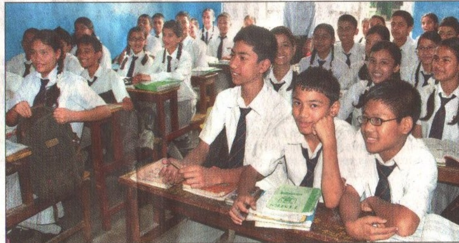
Ein Blick in eines der Klassenzimmer der „Time-School“. Dicht gedrängt sitzen die Schüler auf den Holzbänken. Die Bücher werden von den Lehrern nicht selten selbst hergestellt, und die Schuluniform ist obligatorisch.