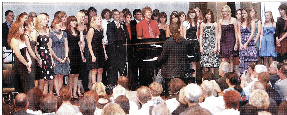
Mit einem Abichor verabschiedeten sich die Schüler am Hartmanni-Gymnasium von ihrer Einrichtung, an der sie die Hochschulreife erlangt hatten.